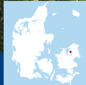
Figur 1 Foreslået placering af anlæg til ny fjordforbindelse ved Frederikssund