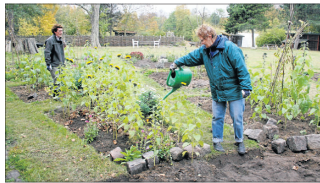
Havelauget og Færggårdens Venner inviterer nu til statusmøde på lørdag, hvor man vil kunne se, hvor langt projektet er nået.