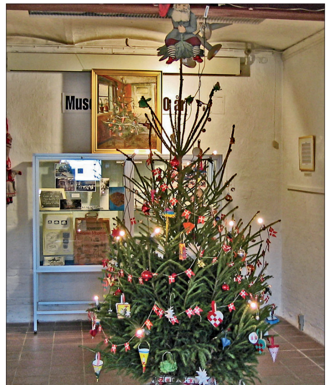
Der er julestue på Mosegaarden den 29. november.