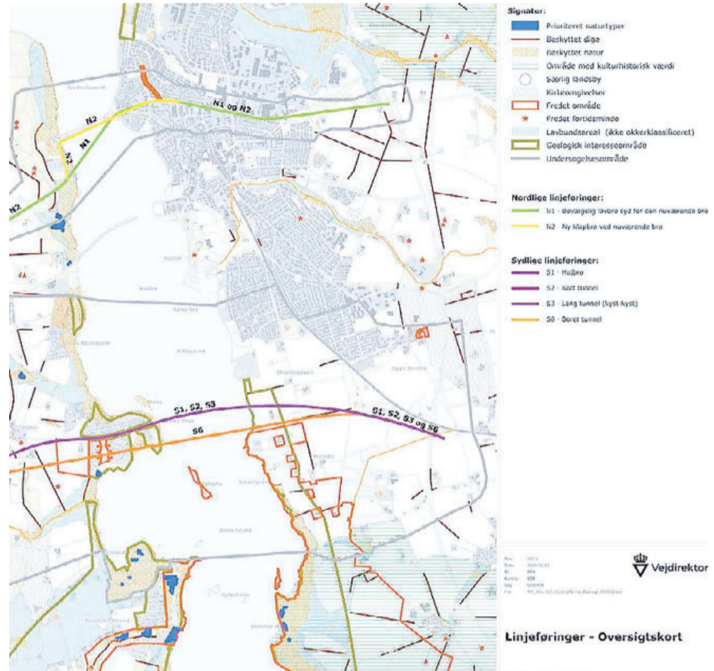
De seks forslag til en ny fjordforbindelse, der fremadrettet arbejdes med i VVM-undersøgelsen. Tegning fra Vejdirektoratets statusnotat.