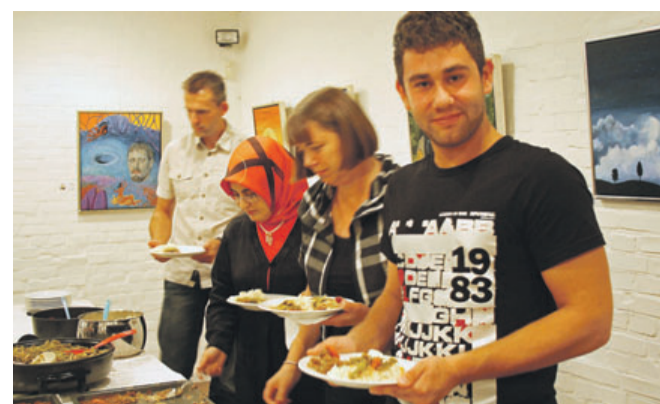
19.44. Der må spises. Solen er gået ned. Ramadanen slutter på lørdag den 19. september og så fester man i tre dage.